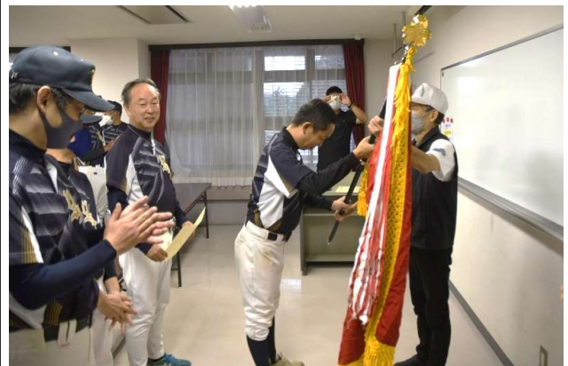
写真上は、壮年級2連覇のYSC=雨天のため屋内での表彰式