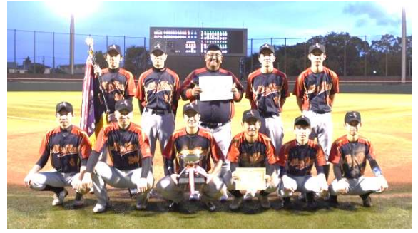
写真上は、B級2連覇のナインフォックス